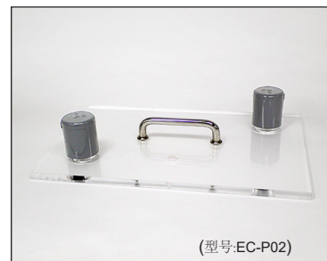
带供气与排气口的箱盖

费加罗技研株式会社 大阪府箕面市船場西1-5-11 邮编: 562-8505 电话: 81-72-728-2044 Mail: figaro@figaro.co.jp URL: www.figaro.co.jp